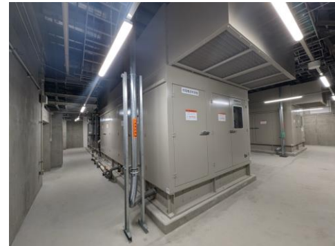
エネルギーセンター内に設置したCGS