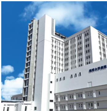
琉球大学病院外観

琉球大学病院は、本年1月に上原地区から西普天間に移転* 2 しました。琉球大学西普天間キャンパス内に構築した本システムは、TGESがシステム設計、施工、エネルギー調達、メンテナンス、監視、オペレーションまで一括して担うエネルギーサービス方式* 3 で導入します。国立大学法人におけるESP事業の採用は初めてです。また、TGESが沖縄県内の医療機関にエネルギーサービスを提供するのも初めてです。