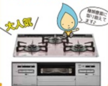
※画像、イラストはイメージです