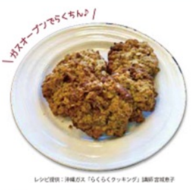
レシピ提供：洋菓店「らくらくクッキング」講師宮城真希

ワンポイント ※焦げた部分はおし金でそぎ 落とすようにしましょう! ※オーブンが無い時はナッツ類を フライパンで乾煎してからロー ストする