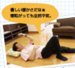
優しい暖かさだから寝転がっても全然平気。

足元からポカポカ暖かく、しかもお部屋全体にムラなく広がります。エアコンのように温風を循環させないのでお部屋の乾燥を防ぎ、お肌にもノドにもやさしく快適です。