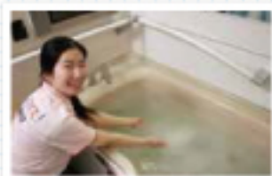
マイクロバブルの気泡は通ずりも良く、肌にしっとりくる感じですよ〜

目に見えないほどの超微粒子のミストが通常の倍の発汗を促進。また、入浴後の肌の保水量も約5倍になります。