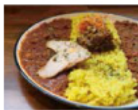
2種類のカレー盛り チキン・キーマ 980円