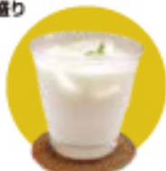
自家製ヨーグルトラッシャー 300円。 食事と一緒に飲むとドリンク 100円引き