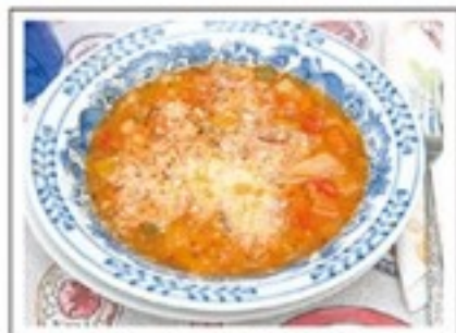
野菜がたっぷり! 貝だくさんの「ミネストローネスープ」