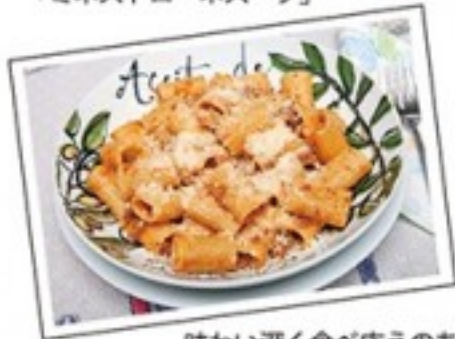
味わい深く食べ応えのある「ラゲソースの Pasta」

イタリアの家庭料理との出会いは、40代に語学留学で北イタリアのヴェローナに通っていて、いつもステイしていた友人宅の家庭の味で、そこで習得した本場イタリア家庭料理の味を再現したいという思いから、自宅教室を本格的に始めました。イタリア家庭料理の魅力は美味しいことはもちろんですが、作る