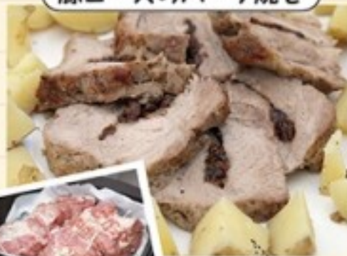
豚ロースのハーブ焼き