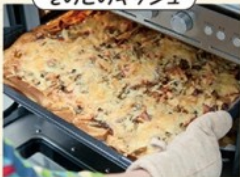
きのこのキッシュ