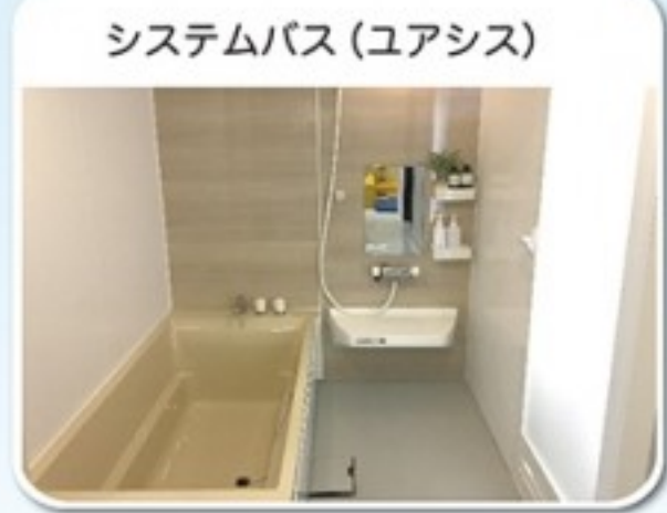
システムバス (ユア시스)