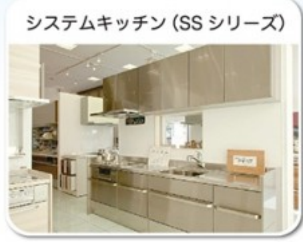
システムキッチン (SS シリーズ)

業界をリードするクリナップの技術が生み出したステンレス製システムキッチン。クリナップ独自の技術が詰まったシステムキッチンやシステムバスなどが豊富に展示されています。