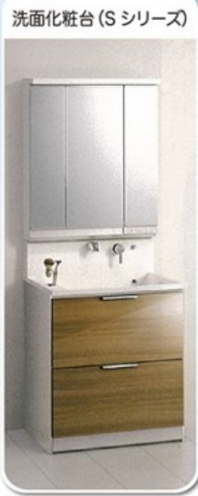
洗面化粧台 (S シリーズ)