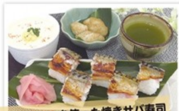
魚焼きグリルを使った焼きサバ寿司

最新ガスコンロの 選び方や使い方を コンロお試し隊と一緒に 体験してみませんか？ 沖縄ガスのショールームには最新ガスコンロが展示・販売されていますが、機器の種類が豊富で選ぶのに迷ってしまうのが悩みのタネ。 そんな時頼りになるのが、コンロお試し隊（主婦が中心のメンバー）。実際に自宅でガスコンロを使っているだけに、お客さまのニーズに合った機器の提案、アドバイスをしてくれます。 主婦だからこそ、提案できること。 もちろん選び方だけではなく、使い方だって主婦目線で応えてくれます。 これまでのガスコンロのイメージをくつがえす、最新ガスコンロの機能を活かしたレシピ作りなどのレクチャーも毎月行っていて、専門スタッフのアドバイスを受けながらコンロお試し隊と一緒に最新ガスコンロの便利な機能を体験することができます。さすが場数を踏んでいるだけのことはある、コンロお試し隊のアイデアレシピは目からうろこの新発見ばかり！ まるでランチに行く感覚で自分で作ってランチができちゃうプチランチクッキングや、ガスコンロを一人様1台使用でき、機能がしっかり使いこなせるようになるお試しクッキングなどを開催しています。 驚異的に進化したガスコンロの機能を是非体験してみてください！