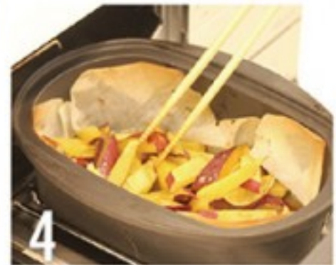
4 グリルに入れて20分加熱。余熱10分。

今回はほくほくあま〜いスイートポテトを作ります。 サツマイモをカットしてオーブンに入れるだけ！