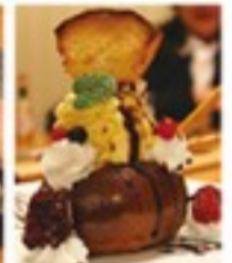
手作りパンの ハニートースト