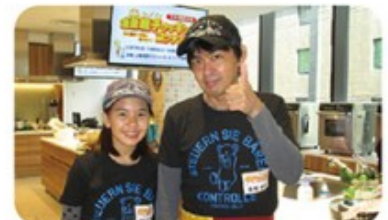
3位入賞おめでとうございます!

とてもレベルの高い強豪揃いの親子の中、見事「第3位」という輝かしい成績。これからもお父さまと一緒に料理を作って楽しんで頂けたら幸いです。