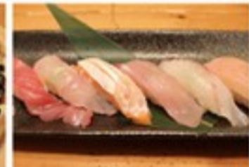
にぎり寿司盛合せ