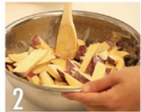
2 水でといた砂糖をサツマイモに絡めます