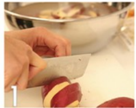
1 サツマイモを食べやすい大きさにカットし水にさらします