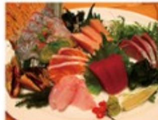
さしみ盛り合わせ