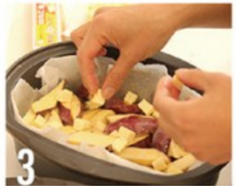
3 ダッチオーブンにクッキングシートを敷きサツマイモを並べて角切りにしたバターをのせます