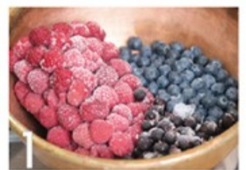
1 フランボワーズ、ベリー、カシスと砂糖を鍋に入れ火にかける