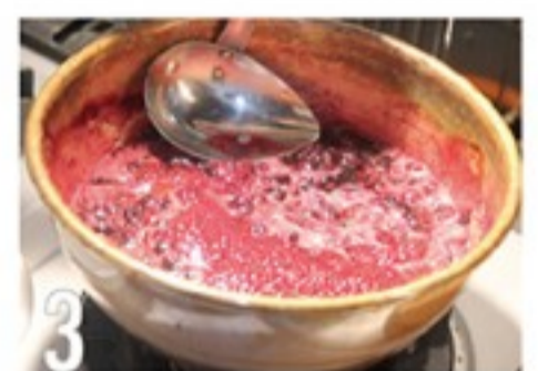
3 レモン汁を加え、あくが出てきたらいいにすくう