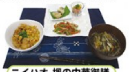
ニイハオ 楓の中華御膳