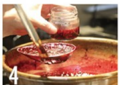
4 あぶくにツヤが出てきたらペクチンを入れ熱いうちに瓶に詰める

ポイント ペクチンを入れると粘りが出ます。あらかじめ少量の砂糖と合わせておくといいでしょう。