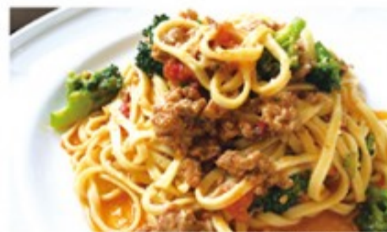
手打ちパスタコース (1,380円)