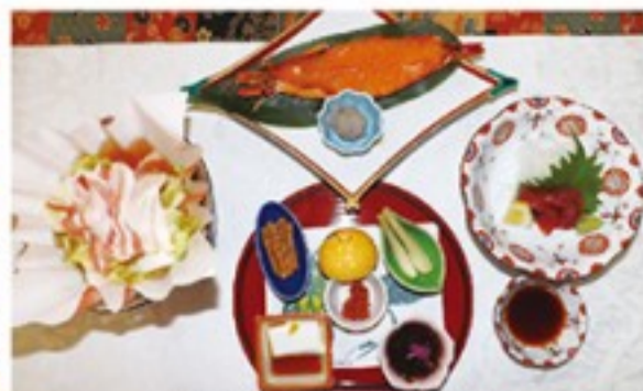
前菜と有頭海老の雲丹焼