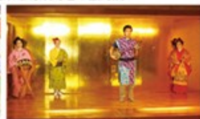
華麗な琉舞と民謡