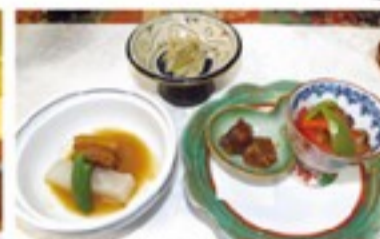
ムジのお浸し・茄子田楽・ラフテー